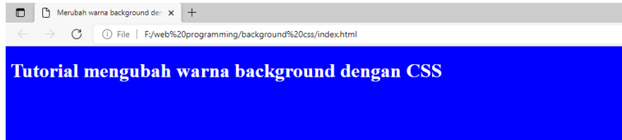
cara merubah warna dengan css

pada syntax css kita menentukan body yang akan di modifikasi kemudian memberikan property background dengan value blue (biru) dan warna color font dengan warna white (putih).